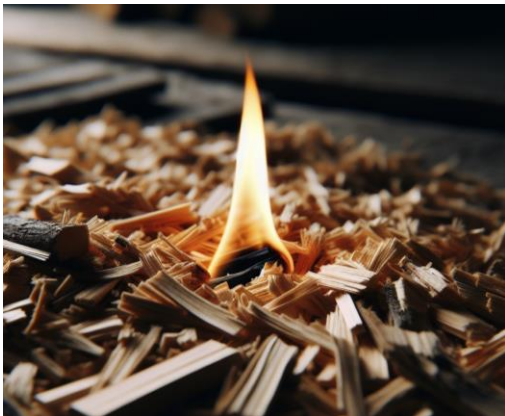
Generiert mit Designer