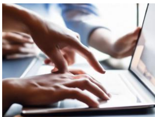
Generiert mit DALL·E